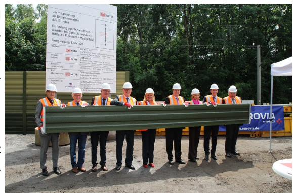
Gemeinsam wurde das letzte Element in die Lärmschutzwand eingesetzt

Die Maßnahme wird vollständig aus Bundesmitteln finanziert, insgesamt stehen in diesem Jahr 150 Mio. € im Lärmsanierungsprogramm des Bundes zur Verfügung.