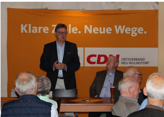
MGB zu Gast beim Ortsverband Neu Wulmstorf

(ch) Den Auftakt zu den „Sommerlichen Gesprächen 2016“ machte der CDU Ortsverband Neu Wulmstorf, der den Bundestagsabgeordneten zu einer Veranstaltung nach Neu Wulmstorf eingeladen hatte.