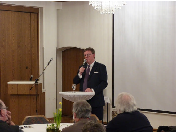
Michael Grosse-Brömer „Bericht aus Berlin“ in Nenndorf

(ch) Die CDU-Ortsverbände Rosengarten und Buchholz luden den MdB Michael Grosse-Brömer zu einer gemeinsamen Veranstaltung unter dem Titel „Bericht aus Berlin“ nach Nenndorf ein.