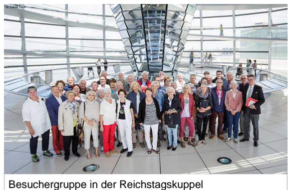
Besuchergruppe in der Reichstagskuppel

Außerdem konnten die Besucher eine Debatte im Deutschen Bundestag und eine Sitzung des Bundesrates live verfolgen.