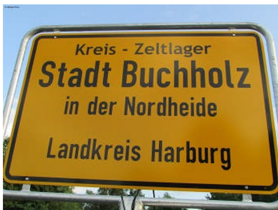
Die Jugendfeuerwehren aus dem Landkreis Harburg waren eine Woche zu Gast in Buchholz. Am 25.06. nahm MGB an der feierlichen Eröffnung der Ferienfreizeit teil.